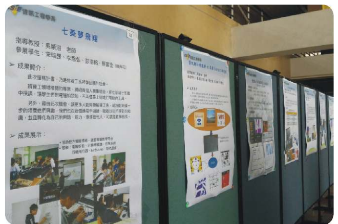
〈資工系小小成果展覽現場實況〉